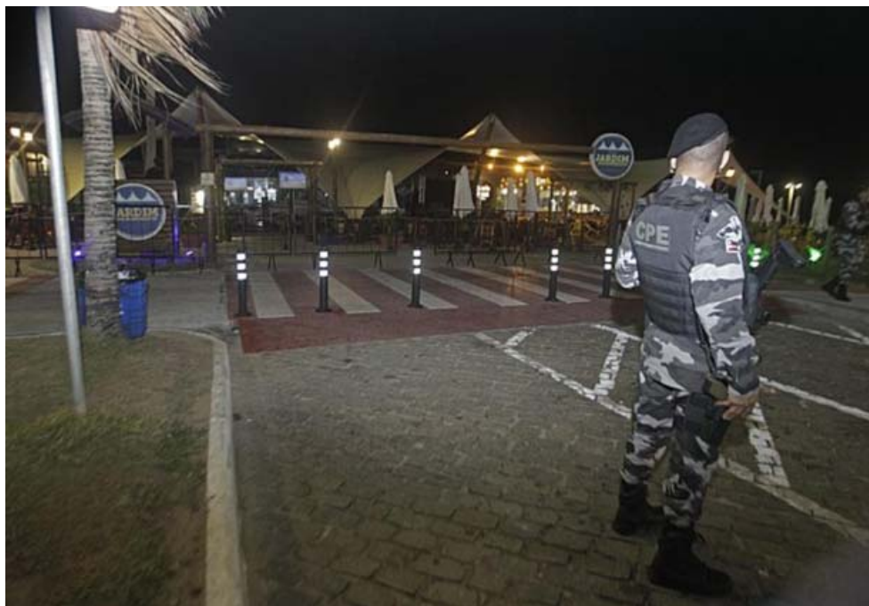
Para toda a Bahia segue proibida a circulação de pessoas entre 20h e 5h, até o dia 1º de abril, em todos os 417 municípios baianos.

TODA A BAHIA - Com exceção de deslocamentos por motivos de saúde ou em situações em que fique comprovada a urgência, segue proibida a circulação de pessoas entre 20h e 5h, até o dia 1º de abril, em todos os 417 municípios baianos. O funcionamento dos serviços não essenciais está proibido em toda a Bahia das 18h de 19 de março até às 5h de 22 de março. A restrição da venda