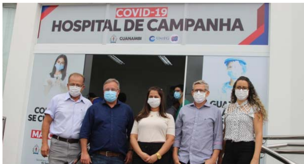
A adaptação da estrutura foi feita em apenas 8 dias desde a cessão do espaço, localizado na Avenida Barão do Rio Branco, feita pela Universidade.

presença do prefeito Nilo Coelho, de seu vice Nal, de autoridades do legislativo e do executivo municipal, da imprensa local, contou também com os presidentes dos Consórcios Públicos Interfederativo de Saúde do Alto Sertão e de Desenvolvimento Sustentável do Alto Sertão, os prefeitos de