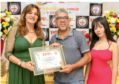
DIU SONORIZAÇÃO MELHOR SOM E ALUGUEL DE SOM PARA FESTAS E EVENTOS EM GERAL 19 ANOS DE MERCADO 03 ANOS DE DESTAQUE ( CHAVE DE OURO ) AV. VIVI DE CASTRO DONATO, 389 FONE: 77 99104-8218 / 77 99926-7320