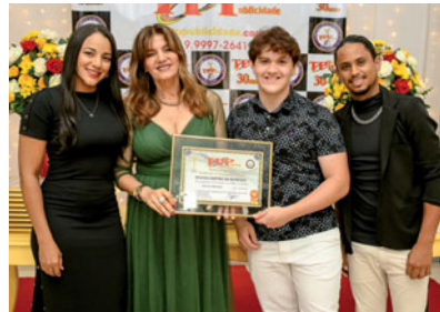
STATUS CENTRO DE ESTÉTICA SALÃO DE CABELEREIRO 35 ANOS DE MERCADO 09 ANOS DE DESTAQUE ( TROFÉU DE OURO ) RUA JUSCELINO GOMES CARDOSO, 50 - CENTRO FONE: 77 3451-2556