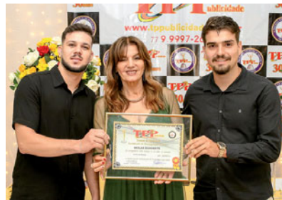
MOLAS SUDOESTE POSTO DE MOLAS 21 ANOS DE MERCADO 17 ANOS DE DESTAQUE ( TROFÉU DE OURO ) AV. BARÃO DO RIO BRANCO, 1.734 - CENTRO FONE: 77 3451-4444 / 77 98802-0825