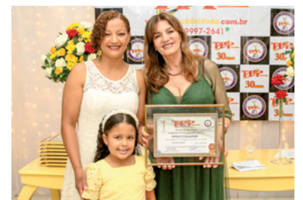
STYLU'S CALÇADOS LOJA DE CALÇADOS - 31 ANOS DE MERCADO 15 ANOS DE DESTAQUE ( TROFÉU DE OURO ) RUA 02 DE JULHO, 14 - CENTRO RUA MEM DE SÁ, 97 - BAIRRO VOMITAMEL FONE: 77 3451-5088