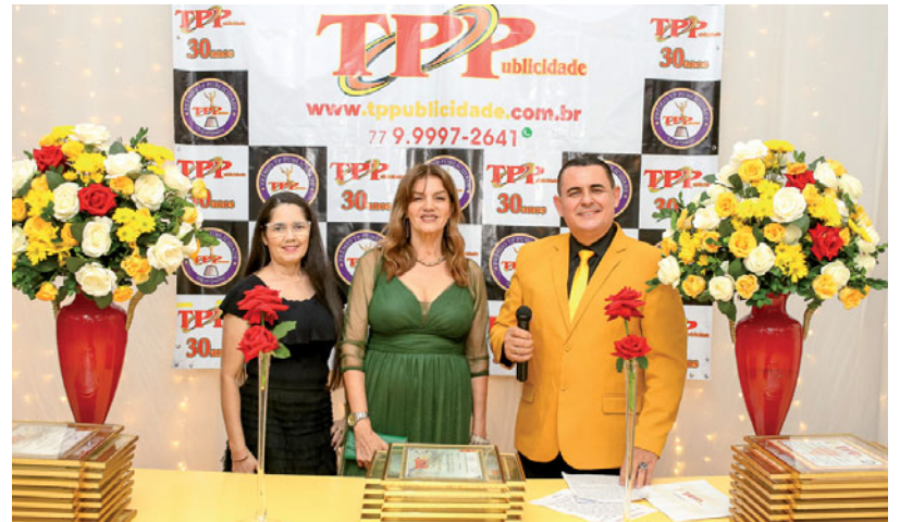
Equipe TP Publicidade.

Nesse evento destacamos o que há de melhor em nosso setor. Seremos guiados pelo brilho da criatividade, pela paixão, pelo que fazemos e pela inovação que sempre esteve no nosso DNA. As honrarias que foram entregues hoje são um reconhe-