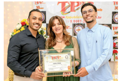
ARENA PRIME ACADEMIA 08 ANOS DE MERCADO 07 ANOS DE DESTAQUE ( TROFÉU DE OURO ) RUA MAJOR FERREIRA, 144 BAIRRO SÃO FRANCISCO FONE: 77 99186-0609