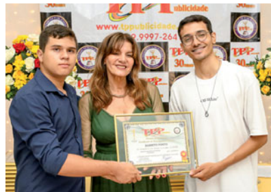
BARRETO PONTO RELÓGIO DE PONTO E CATRACAS E SISTEMAS. 11 ANOS DE MERCADO 08 ANOS DE DESTAQUE ( TROFÉU DE OURO ) AV. TIRADENTES, 1092 - CENTRO FONE: 77 98114-3737