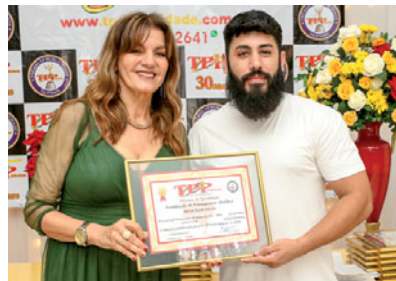
BEIJA FLOR SOLAR ENERGIA SOLAR - 05 ANOS DE MERCADO Av. Messias Pereira Donato, 1.249 Bairro São João - Fone: 77 98159-7711