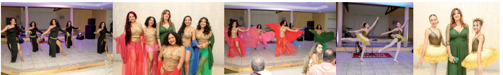
Balé e Teatro Casa Cultural Iana Rocha.