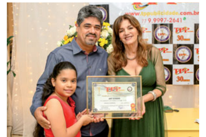
ART SCREEN SERIGRAFIA E SUBLIMAÇÃO 28 ANOS DE MERCADO 17 ANOS DE DESTAQUE ( TROFÉU DE OURO ) AV. OTÁVIO MANGABEIRA, 1.715 - NOVA MORADA FONE: 77 3451-4853 / 77 99978-8899