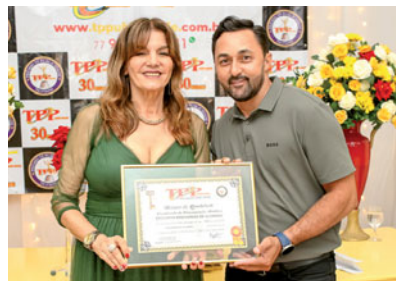
EXCLUSIVE ESQUADRIAS DE ALUMÍNIO ESQUADRIAS DE ALUMÍNIO 09 ANOS DE MERCADO 05 ANOS DE DESTAQUE ( CHAVE DE OURO ) TRAVESSA MAURA GOMES BARROS, 105 - BAIRRO SANDOVAL BARROS FONE: 77 99951-9280 / 77 98141-7231