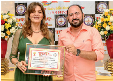
GRUPO VIVER BEM ASSISTENCIA FAMILIAR FUNERÁRIA E LOCAÇÃO DE PRODUTOS HOSPITALARES 05 ANOS DE MERCADO Rua Edgar Teixeira, 90 - Bairro São Francisco Fone: 77 99804-1182