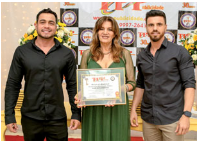
FLEX SUPLEMENTOS LOJA DE SUPLEMENTOS - 06 ANOS DE MERCADO 02 ANOS DE DESTAQUE (Chave de Ouro) Av. Guanabara, 104 - Centro Fone: 77 99104-1673 / 77 99130-3388