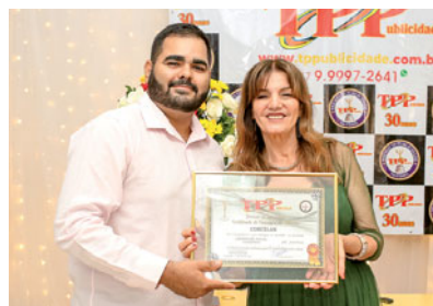
CORCELAN LANTERNAGEM, PINTURA E ACESSÓRIOS 43 ANOS DE MERCADO 16 ANOS DE DESTAQUE ( TROFÉU DE OURO ) RUA 1º DE MAIO, 348 - CENTRO FONE: 77 3451-2761