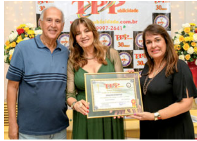
SPAÇOS EVENTOS ESPAÇOS DE FESTAS 23 ANOS DE MERCADO 11 ANOS DE DESTAQUE ( TROFÉU DE OURO ) AV. IPIRANGA, S/N - BAIRRO IPIRANGA FONE: 77 3451-1878 / 77 9962-1986