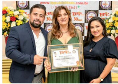
CASA DE CARNES PREMIUM GRILL CASA DE CARNES - 06 ANOS DE MERCADO 02 ANOS DE DESTAQUE (Chave de Ouro) Av. Santos Dumont, 725 - Bairro - Aeroporto Velho Fone: 77 99867-6419