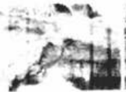
Gruta da Mangabeira