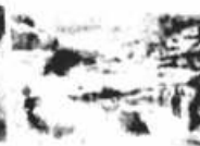
Sica da Água Preta

O Jornal TRIBUNA DO SERTÃO é uma publicação da Base Comunicação e Marketing Ltda.