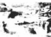
Bica da Água Preta