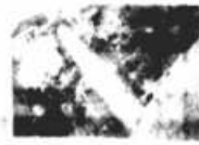
Cachoeira das Moendas