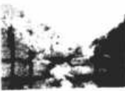
Rio Mato Grosso