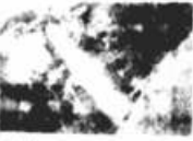
Cachoeira das Moendas