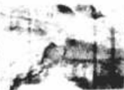
Gruta da Mangabeira