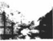
Rio Mato Grosso