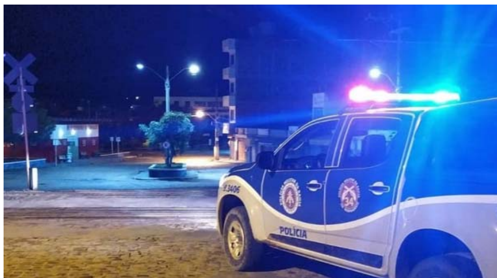
O toque de recolher foi determinado em 343 cidades baianas pelo Governo do Estado dura das 22h às 5h, entre 19 e 25 de fevereiro.

Entre os dias 19 e 25 de fevereiro, a 34ª Companhia Independente de Polícia Militar (CIPM) atuou para garantir o cumprimento do decreto do governador do Estado, Rui Costa (PT), que determinou o toque de recolher, das 22h às 5h, nas cidades de sua área de abrangência (Brumado, Malhada de Pedras, Guajeru, Rio do Antônio, Aracatu, Maetinga, Presidente Jânio Quadros, Tanhaçu, Ituaçu, Contendas do Sincorá, Barra da Estiva e Ibicoara). A determinação visou a redução da taxa de crescimento da Covid-19 no estado, que já ceifou a vida de mais de 11 mil baianos.