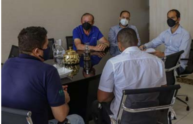
A reunião tratou de assuntos sobre desenvolvimento rural, agricultura familiar e o acesso à água potável para comunidades rurais.

A Companhia de Desenvolvimento e Ação Regional é um órgão do Governo do Estado da Bahia, que tem como