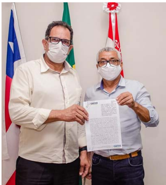
A assinatura ocorreu com data retroativa a 01/01/2021, garantindo os recursos de janeiro e fevereiro de 2021.

A Prefeitura de Caetité e a Fundação Hospitalar Senhora Santana (FHSS) celebraram convênio para repasses financeiros entre o município e a entidade objetivando a oferta de serviços na área da saúde à população. O convênio estava encerrado desde o dia 31 de dezembro de 2020. A assinatura do contrato ocorreu com data retroativa a 1º de janeiro deste ano, o que garante o repasse de recursos dos meses de janeiro e fevereiro de 2021.