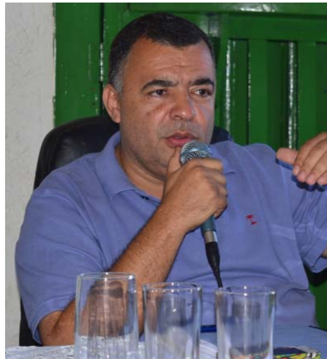
Os conselheiros aprovaram as contas do exercício de 2019 em sessão realizada na última quinta-feira (11), por meio eletrônico.

O relatório técnico registrou, como ressalvas, a recorrente baixa cobrança da dívida ativa; omissão na cobrança de multa (R$ 9.823,54) e ressarcimento (R$