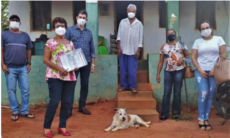
A visita, que ocorreu na última terça-feira (23), contemplou os moradores das comunidades rurais de Água Branca e de Mandacaru.

Moradores das comunidades rurais de Água Branca e de Mandacaru receberam, na última terça-feira (23), uma visita da Secretaria Municipal de Assistência Social, que os apresentou ao projeto Secretaria Itinerante. De acordo com a Secretaria de Assistência Social, em nota "[a pasta] visa estar cada vez mais presente na vida da população, atendendo as demandas sociais e oferecendo serviços importantes e necessários para a valorização dos cidadãos e cidadãs."