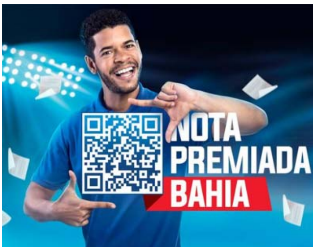
O prêmio de R$ 100 mil foi para um participante de Salvador. Dos 90 prêmios de R$ 10 mil, 53 foram para Salvador e 37 para o interior.

Além dos 91 prêmios mensais, a campanha também realiza periodicamente sorteios especiais de R$ 1 milhão, que contemplam um único