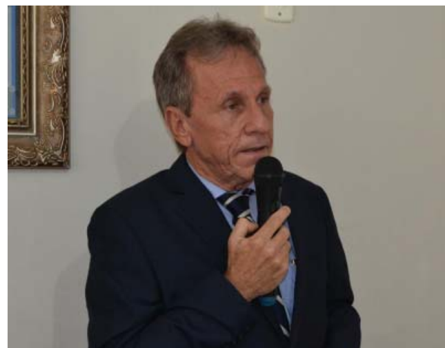
O Prefeito anunciou o cancelamento da próxima feira-livre na próxima segunda e a limitação do funcionamento do comércio não essencial, que só poderá funcionar até às 16h.