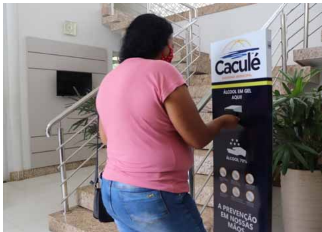
Os totens possuem um sistema de dispensação de álcool em gel, que é acionado na base pelos pés, evitando o contato com as mãos.

O Governo de Caculé, através da Secretaria Municipal de Saúde, adquiriu 50 totens com álcool em gel, que serão instalados em todos os órgãos públicos do município. Até o momento, os equipamentos já foram colocados na sede da